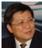
汤敏 , 国务院参事 / 友成企业家扶贫基金会常务副理事长 / 友成新公益大 学校长