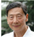
茅于軾 , 著名经济学家 / 天则经济研究所创始人, 常务理事